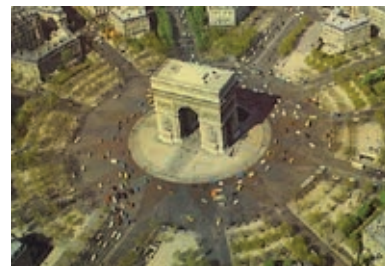
Rond-point de l'Etoile à Paris

Le rond-point est, quant à lui, de plus en plus rare sur nos routes. On le trouve plutôt dans les grandes villes. Un rond-point bien connu est celui de l'Etoile à Paris. Ainsi, celui qui est à l'intérieur doit céder la priorité à celui qui s'apprête à entrer. C'est donc la priorité à droite qui s'applique