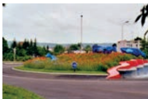
Giratoire « les trois Godelles »

S'il est vrai que les giratoires se sont d'abord multipliés outre-Manche (d'où l'appellation de rond-point à l'anglaise), certains spécialistes attribuent leur paternité à l'architecte français Eugène Hénard, d'autres à l'Américain William Phelps Eno qui a dessiné le Columbus Circle à New York en 1905. Ils existent depuis 1984. La France en compte plus de 40 000.